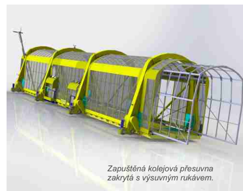
Zapuštěná kolejová přesuvna zakrytá s výsuvným rukávem.