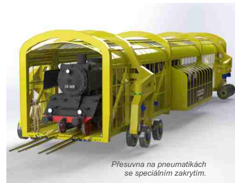
Přesuvna na pneumatikách se speciálním zakrytím.