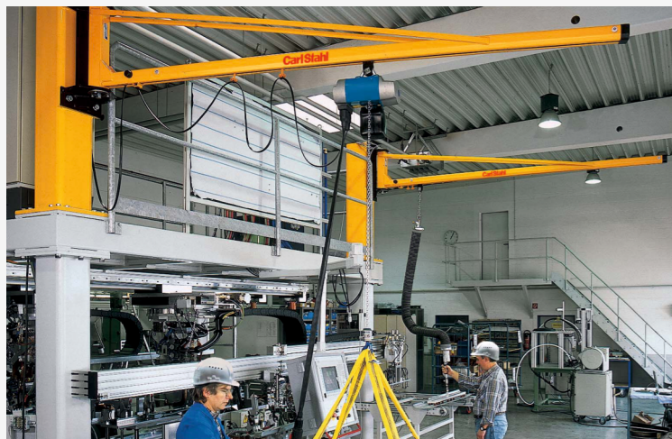
SPECIÁLNÍ SLOUPOVÉ JEŘÁBY