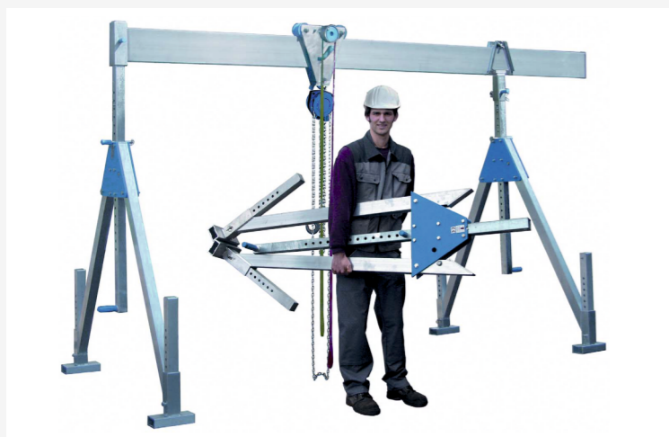
ALU MOBILNÍ PORTÁLOVÉ JEŘÁBY