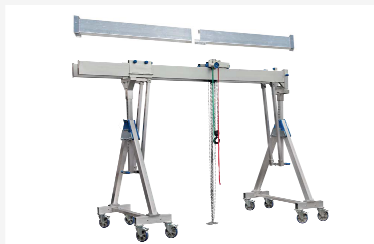
ALU POJÍZDNÉ PORTÁLOVÉ SYSTÉMY