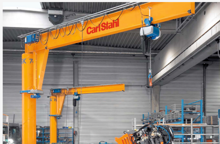
STANDARDNÍ SLOUPOVÉ JEŘÁBY