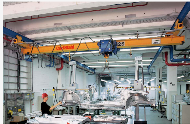
MOSTOVÉ PODVĚSNÉ JEŘÁBY