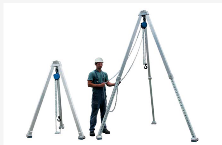
TROJNOŽKY S KLADKOSTROJEM