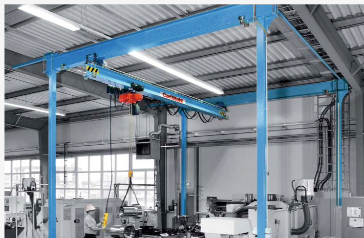
JEŘÁBOVÉ PORTÁLOVÉ SYSTÉMY