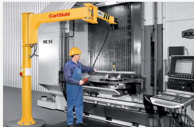
SLOUPOVÉ JEŘÁBY S KLOUBOVÝM ÚLOŽNÍKEM